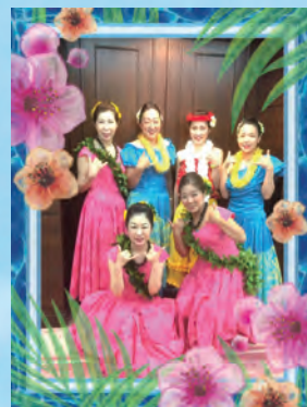
プメハナ フラストアジオ フラダンス