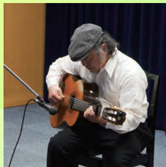
ヨッシー原本 あんがいおまる一座